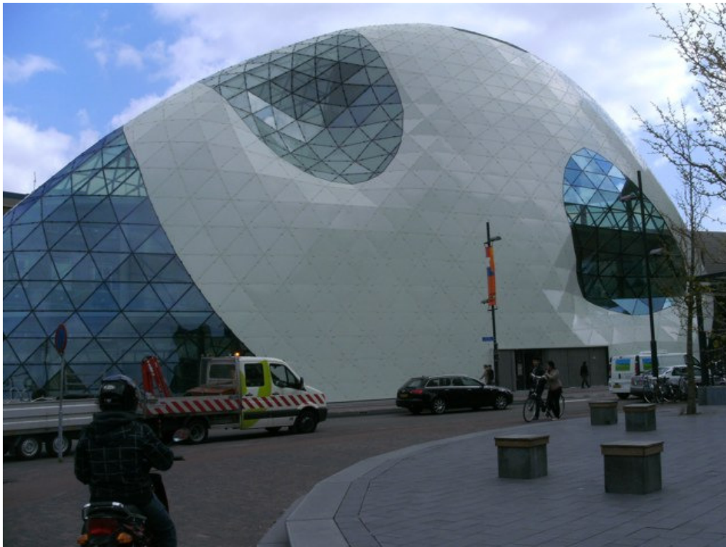
Het huidige KPN-complex leent zich uitstekend voor een theater met gedurfde architectuur.