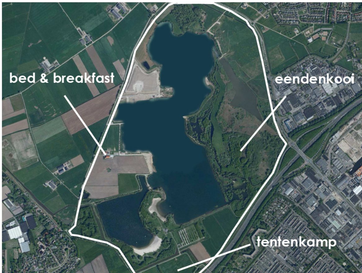
bestaande situatie Engelermeer