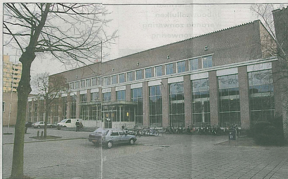
Architectuur van de Bossche School Hal. Onder: Brusselse Poort tussen